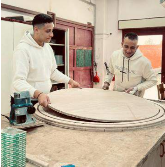
Hilfsmittelbau von Studenten/innen der Universität Bethlehem

den Studenten/innen vorgestellt und gewürdigt. Anschließend werden die gebauten Hilfsmittel in der Therapie eingesetzt.