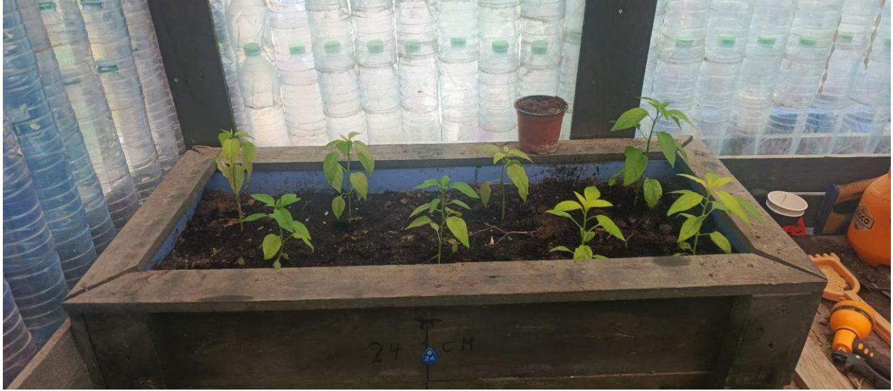
Pflanzbeet im Gewächshaus aus alten Plastikflaschen