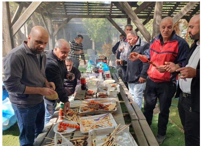
„Rund um den Grill“ – Väter tauschen sich aus und erfahren Ermutigung