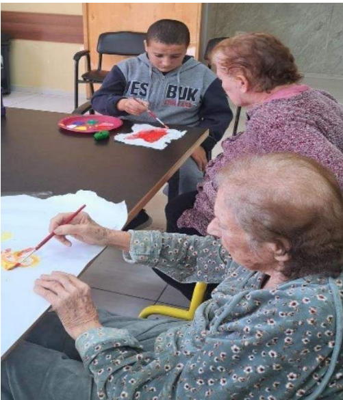
Spielen und malen mit älteren Menschen

Besuche unserer Kinder in den nicht sehr zahlreichen Heimen für ältere Menschen, gehören zu unserem jährlichen Programm. Ganz oft sind die Menschen in den Heimen zwar gut versorgt, haben aber keine regelmässige Ansprache und keine Aktivitäten, die den Alltag bereichern. Umso mehr freuen sie sich, wenn einmal jemand vorbeikommt und dazu noch ein schönes Programm für junge und alte Menschen vorbereitet hat. Im Oktober war es wieder soweit und wir besuchten mit unseren Kindern ein Altersheim und hatten viel Freude miteinander. Wir brachten den älteren Menschen ein kleines (Handschmeichler) Kreuz aus Olivenholz mit und ermutigten sie es beim Gebet in der Hand zu halten. Wir sangen Lieder, spielten und malten miteinander. Eine Gruppe von älteren Menschen luden wir zu uns nach Lifegate ein und sie kamen, um für uns zu singen. Beim anschließenden Mittagessen sahen wir viele frohe Gesichter. Wie so oft im Leben, wenn man etwas schenkt erhält man vielfältige Freude zurück!