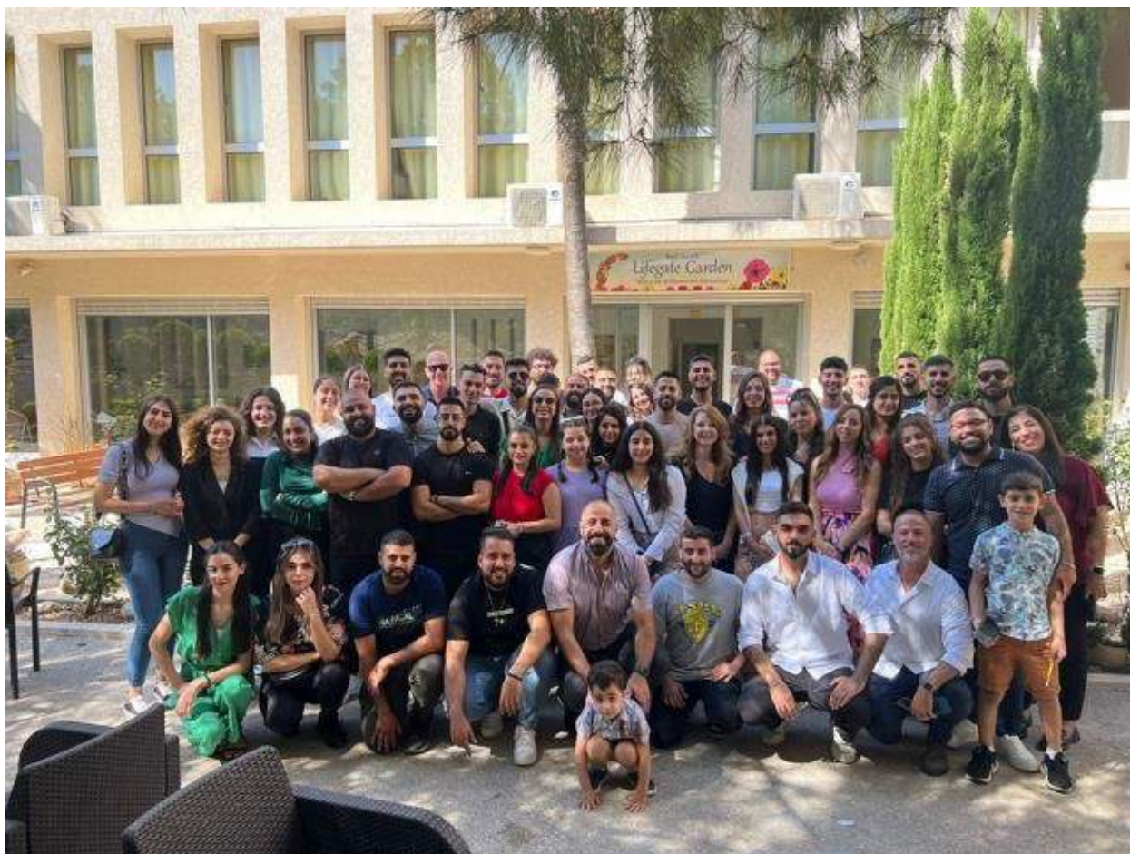
„Young Life“ (Junges Leben) lokale Christen zu Gast in unserem Gästehaus