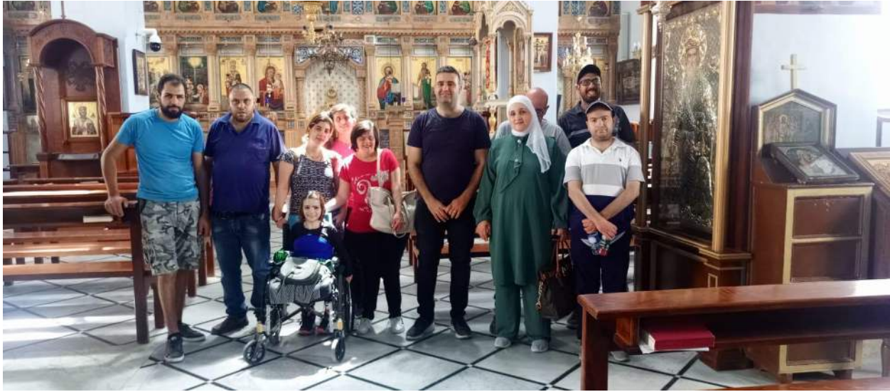
Besuch der griechisch-orthodoxen Kirche in Beit Jala