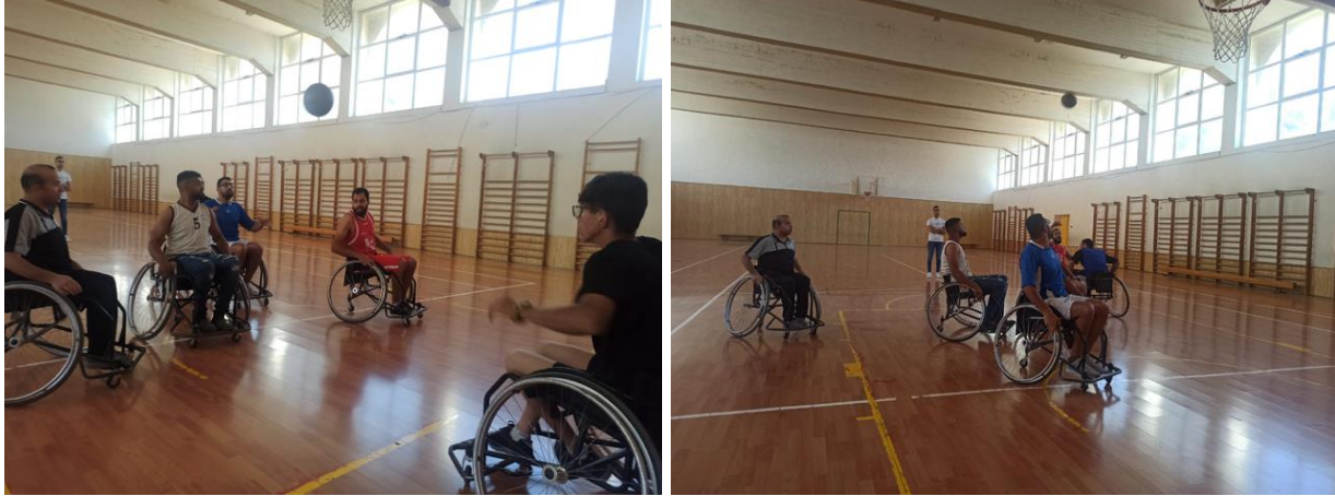
Rollstuhlbasketball Training in der Talitha kumi Schule