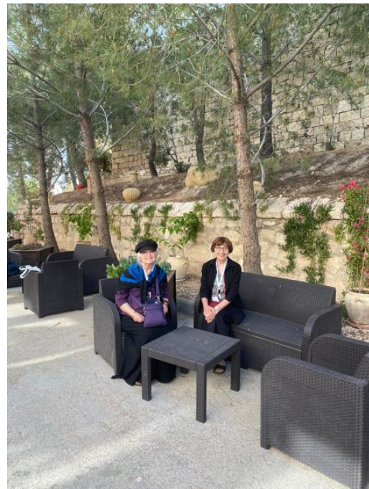
Einzelne Gäste aus Frankreich und den USA in Lifegate Garden