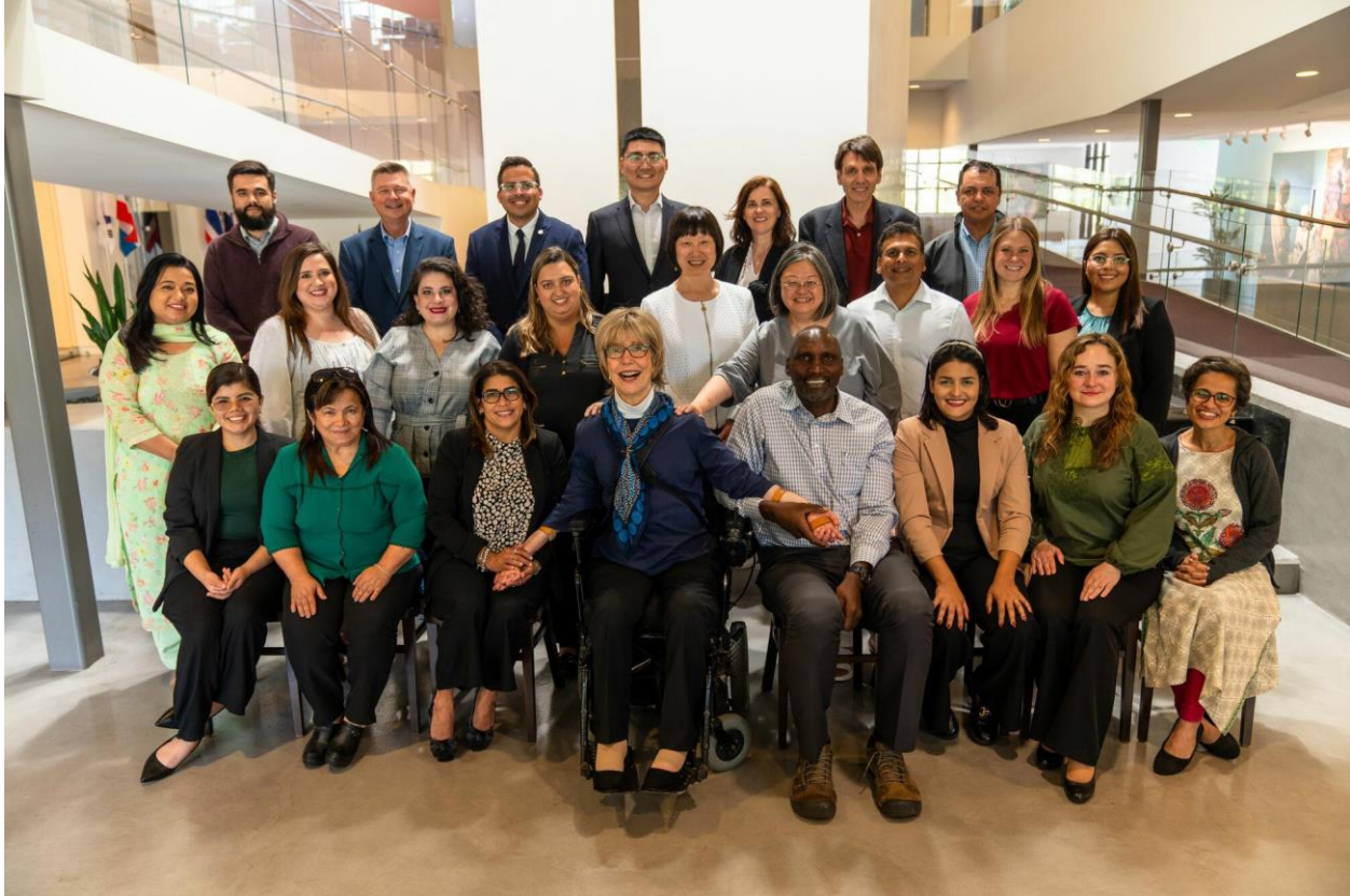
Das Joni and Friends Team aus der ganzen Welt