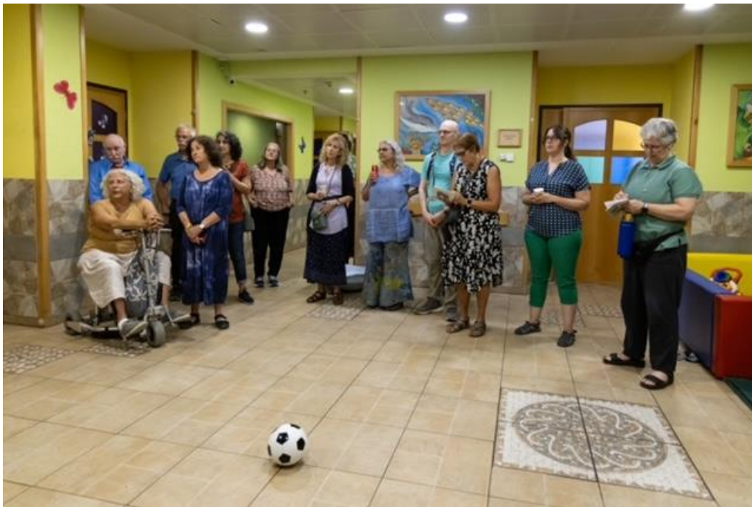
Besucher aus den USA zu Gast bei Lifegate

Schon während der Corona Jahre waren wir sehr unter uns in Lifegate und es ist still geworden im ganzen Land. Seit dem 7. Oktober 2023 kommen einzelne mutige Menschen, um ihre Solidarität und Verbundenheit auch in schweren Zeiten auszudrücken, andere wollen sich persönlich ein Bild machen von diesem Land im Krieg. Wir freuen uns, dass unsere Freunde von „SK Tours in the Nature“ auch bei der zweiten „Friedensreise“ (auf eigene Verantwortung der Teilnehmer) Lifegate ins Programm nahmen und wir 20 Personen aus den USA unsere Arbeit vorstellen konnten. Die erste SK-Gruppe kam im April aus Deutschland und viele Freunde von Lifegate waren als Teilnehmer dabei.