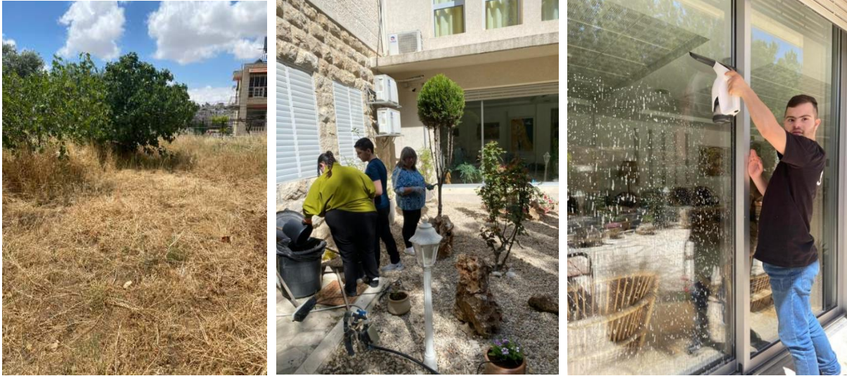
Hier soll der Gemüsegarten entstehen – Unsere „Azubis“ beim Fenster reinigen und der Gartenarbeit