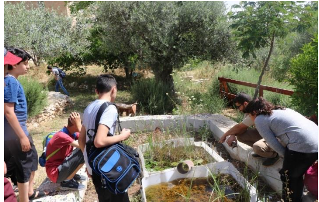
Lifegate Förderschulkinder zu Besuch im Naturkunde Museum Bethlehem