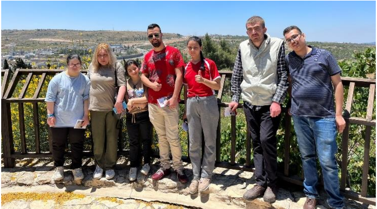
Das Lifegate Küchen „Azubi“ Team in Talitha kumi