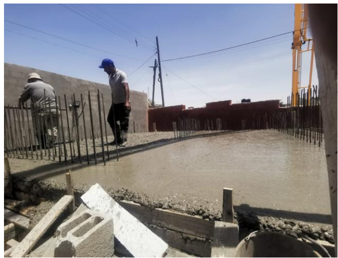
Die Decke des Schutzraumes wird betoniert