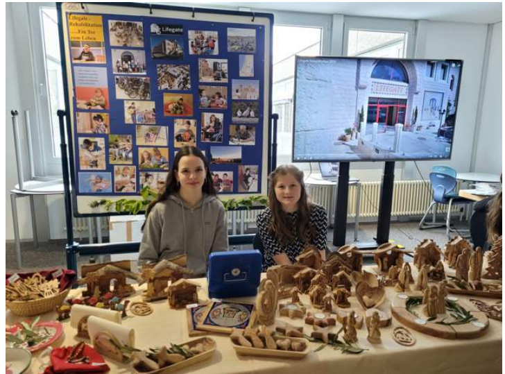
Schülerinnen der Bodenseeschule in Friedrichshafen