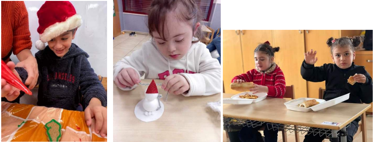
Weihnachtsvorbereitungen in der Schule mit einem leckeren Mittagessen

Kinder haben Freude beim Vorbereiten und Basteln für das Weihnachtsfest in unserer Förderschule. Wir konnten unseren Kindern und ihren Eltern auch in diesen Monaten nach dem 7. Oktober Stabilität, Ausgeglichenheit, Lebensfreude und Hoffnung bei unserer täglichen Förderung und allen Aktivitäten vermitteln.