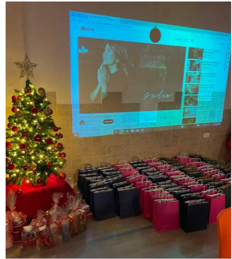
Die von Suher vorbereiteten Geschenke gehörten selbstverständlich dazu