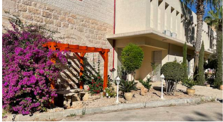
Gästehaus Lifegate Garden