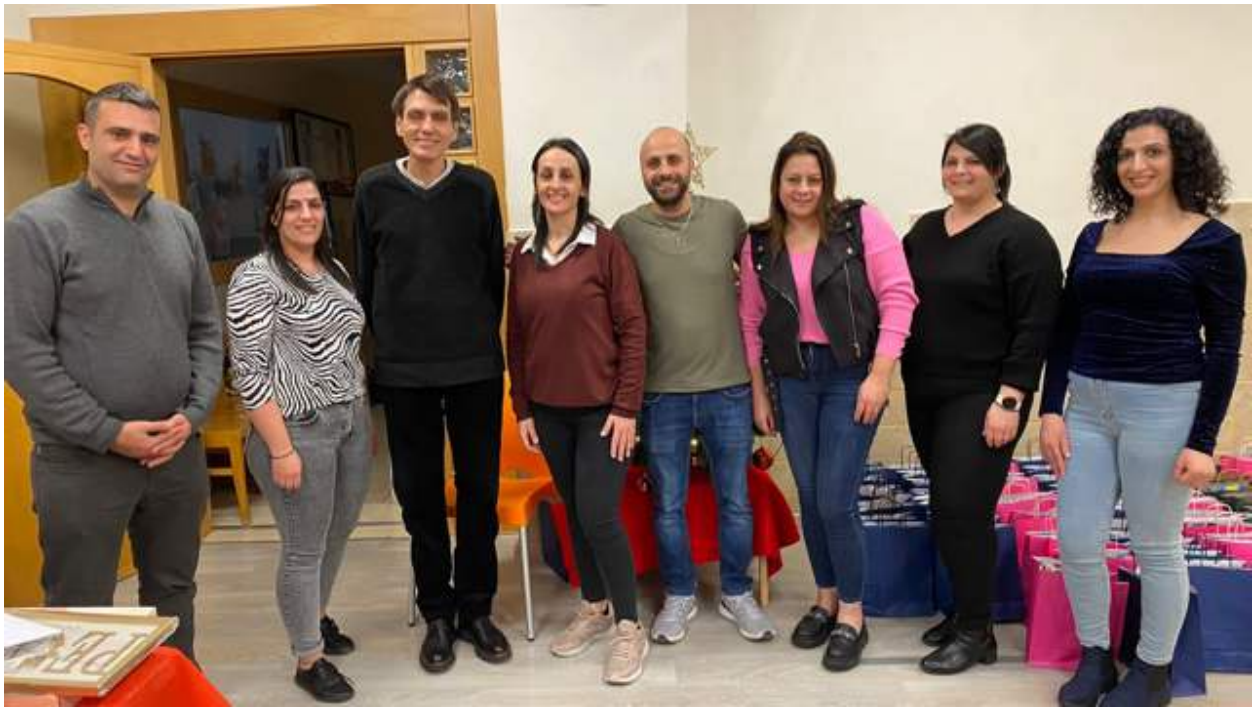
Teamleiter/innen, die unsere Arbeit leiten und verantworten