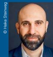
Ahmad Mansour Diplom-Psycho- loge, Autor und Islamismusexperte