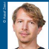
© Assaf Zeevi Assaf Zeevi Landschafts- architekt, Reiseleiter, Autor