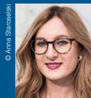
© Anna Staroselski Anna Staroselski Präsidentin der Jüdischen Studentenunion Deutschland