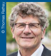
Ernst-Wilhelm Gohl Bischof der Ev. Landeskirche in Württemberg